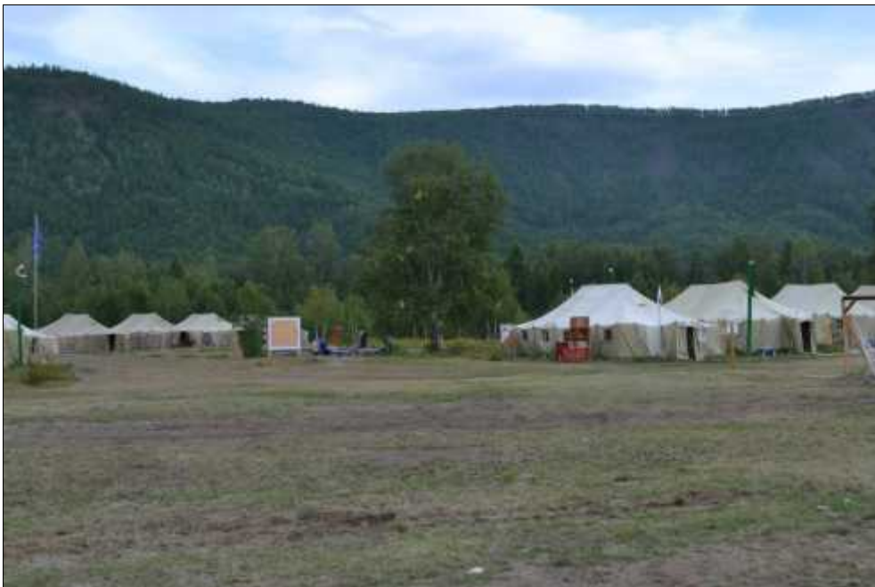
Fig. 3. Tab ra arheologic Jermak.