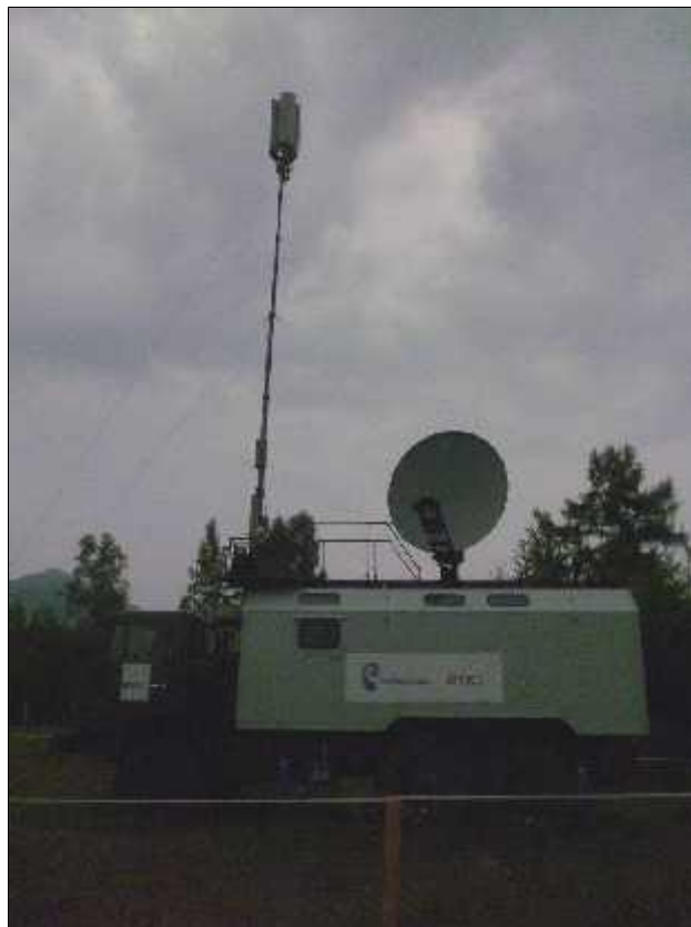
Fig. 9. Wireless în plin taiga.