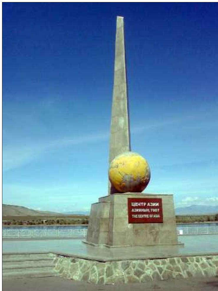
Fig. 5. Centrul Asiei (fotografie: Alexandra Ghenghea).