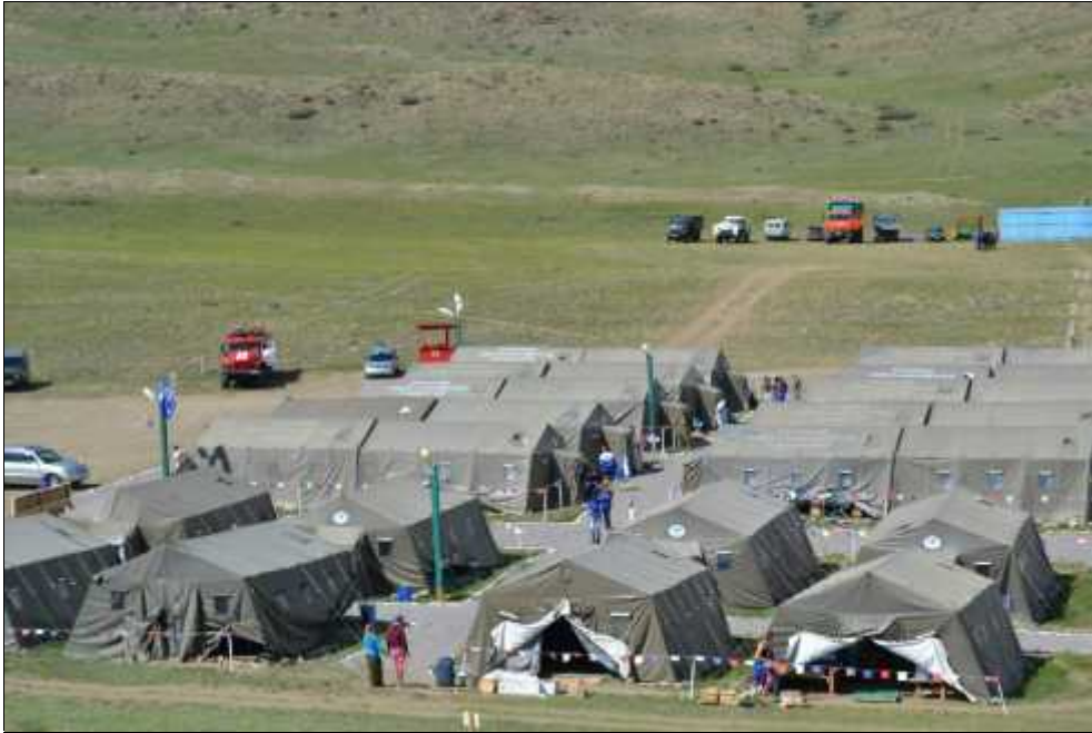
Fig. 2. Tab ra arheologic „Dolina Carej”.