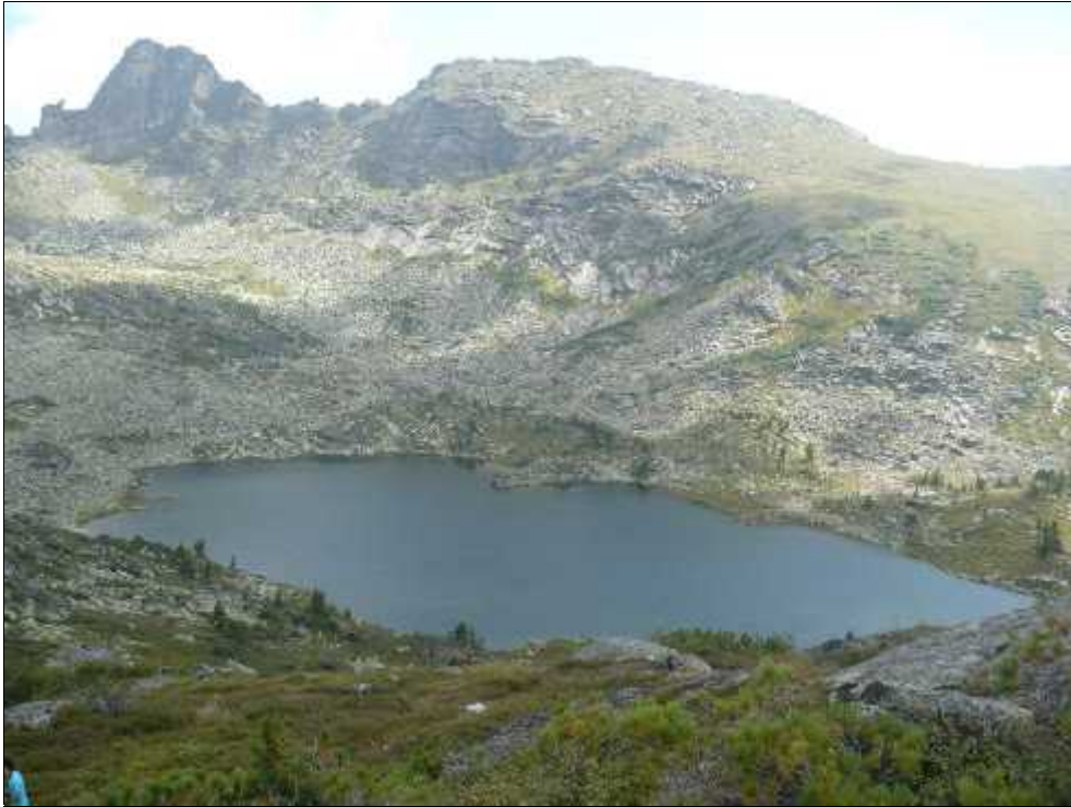
Fig. 6. Lacul Svetloe.