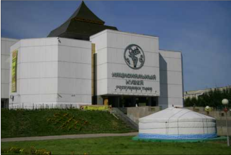
Fig. 4. Muzeul Na ional din Kyzyl.