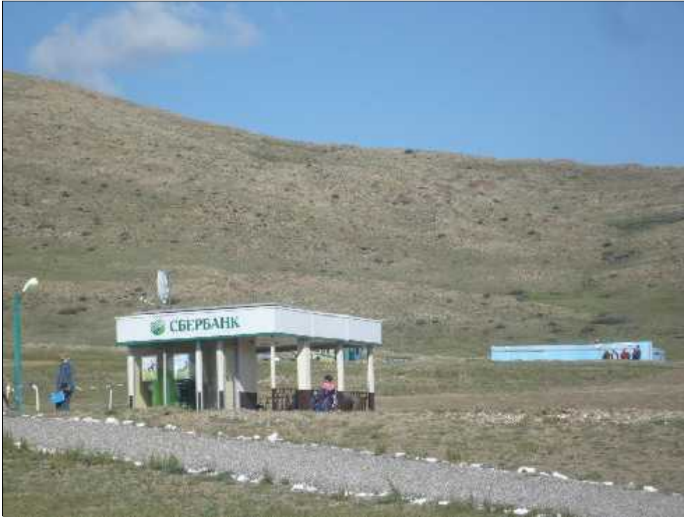
Fig. 8. Bancomat în mijlocul steppei.